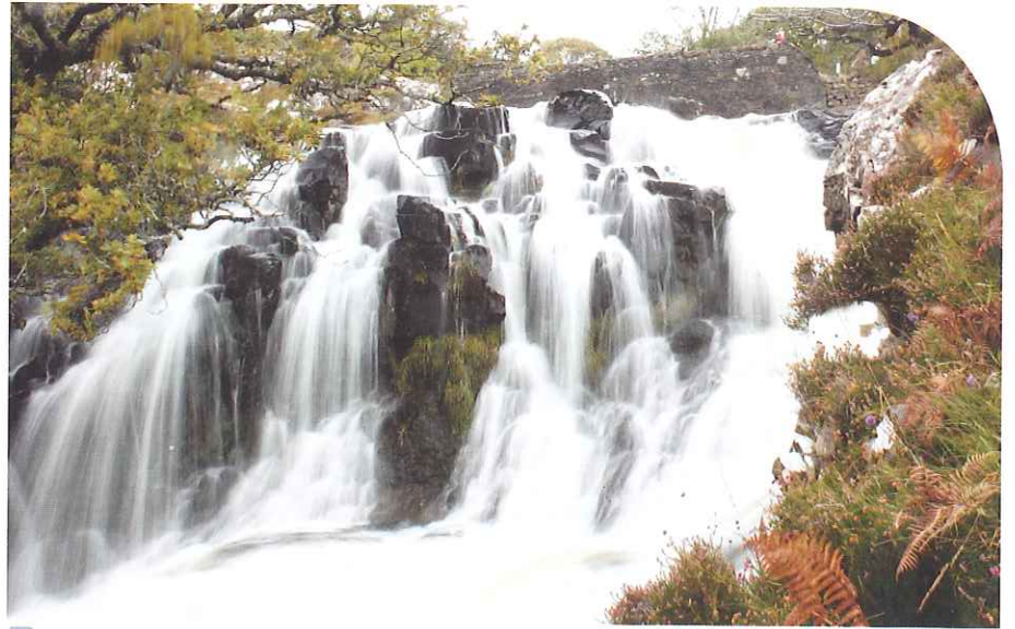
Isle of Mull