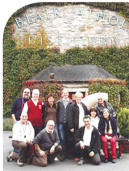
Pot Still Malt Club devant la distillerie Blair Athol

Il nous reste deux heures de route et nous devons donc renoncer à visiter le Country Life Museum d'Atholl. Notre route passant à Dalwhinnie, nous nous arrêtons devant la distillerie pour faire quelques clichés. Arrivée sous la pluie à Fort William en début de soirée.